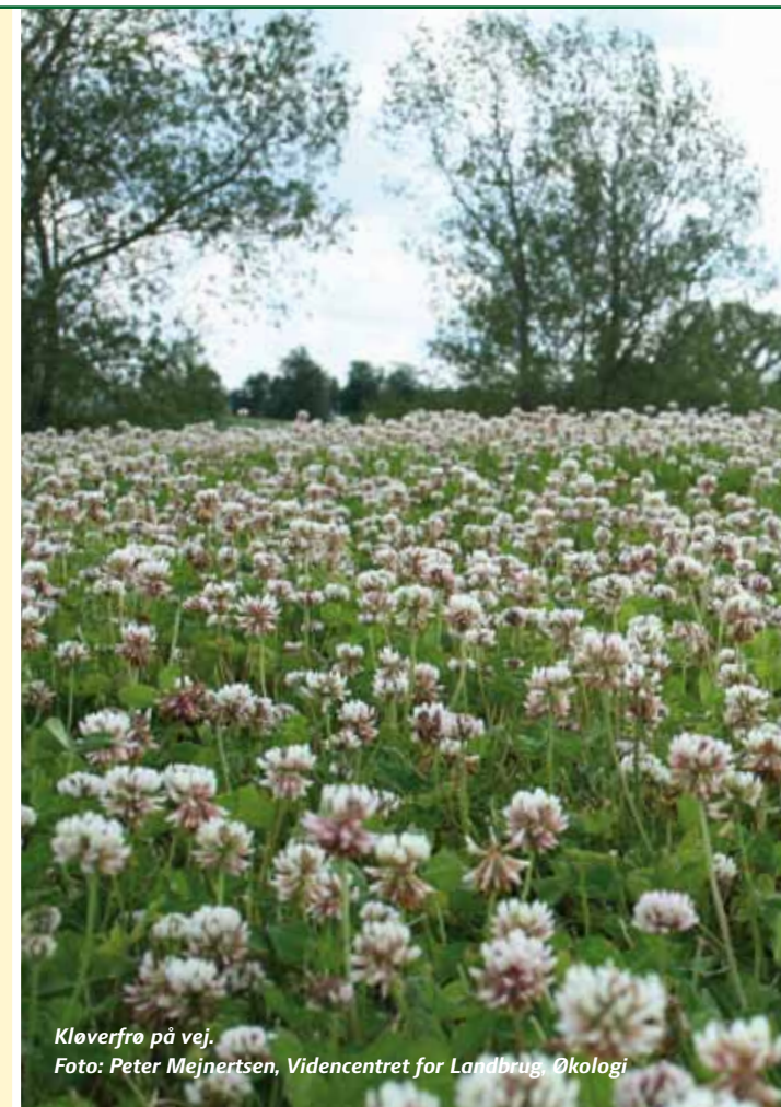
Kløverfrø på vej.

Samtidig med, at det nye værktøj kommer på banen, præsenterer vi en stribe nye dyrkningsvejledninger på LandbrugsInfo for græsfrø og kløverfrø. Så fremtiden som økologisk frøgræsproducent er gjort mere sikker.