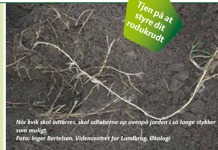
Når kvik skal udtørres, skal udløberne op ovenpå jorden i så lange stykker som muligt.

Arkene udleveres hos din konsulent, hvor du også kan få en faglig snak om tingene, og de kan bruges i erfagrupper i forbindelse med markbesøg. Du kan på LandbrugsInfo under "Økologi" finde vejledninger til bekæmpelse af de enkelte rodukrudderarter.