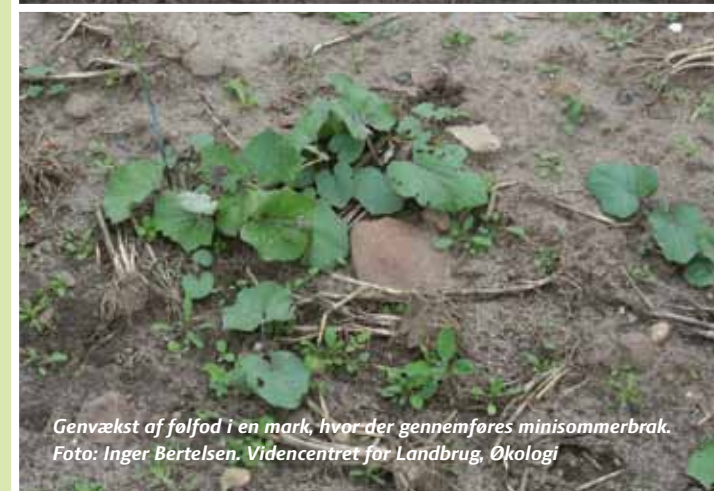
Genvækst af følfod i en mark, hvor der gennemføres minisommerbrak.