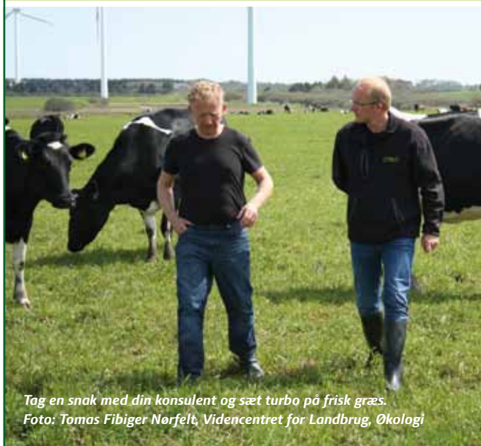
Tag en snak med din konsulent og sæt turbo på frisk græs.